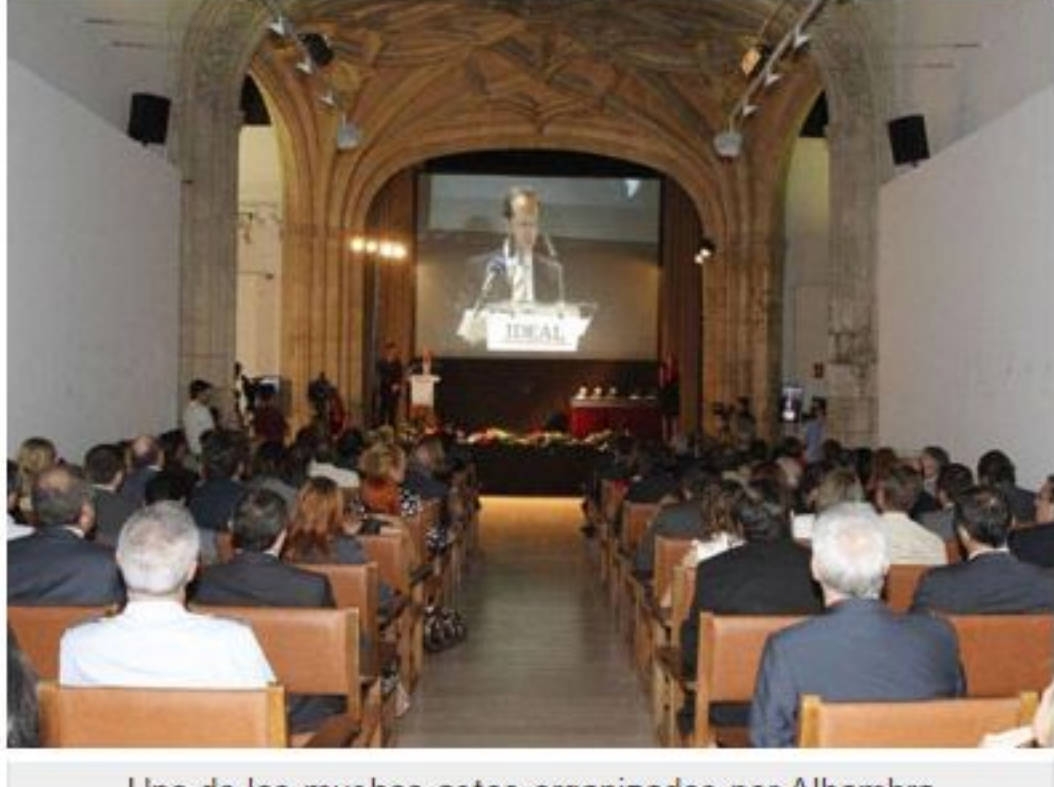
Uno de los muchos actos organizados por Alhambra

Con su profesionalismo y buen hacer, en los últimos 15 años Alhambra ha participado activamente en la planificación, organización y puesto en escena de una larga lista de eventos del calibre del XXXIV Congreso Nacional de SEMERGEN (Málaga, 24-26 de octubre de 2012), la Asamblea General de la Asociación Europea de Cementerios (Carmen de los Mártires, Granada, 1-2 de octubre de 2009), la Exposición "Los jarrones de la alhambra: simbología y poder" (Cripta del Palacio de Carlos V de Granada, 20 octubre de 2006-marzo de 2007), el "World Political Forum" (Palacio de Carlos V de Granada, 8-10 de diciembre de 2005), o el VIII Congreso de la Sociedad Española Medicina General (Granada, 10-13 de mayo de 2000).